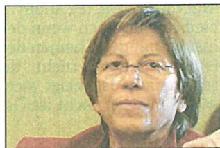
...Klubchefin Jahn kommt